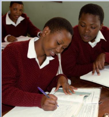
Viele Kinder warten auf die Chance einer Schulbildung