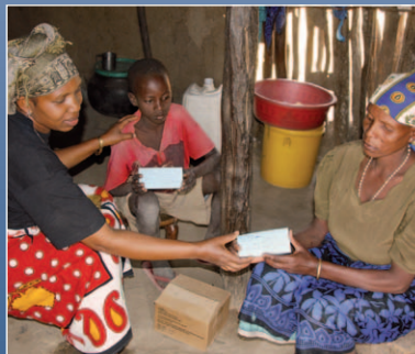
Viele Menschen in Makiungu benötigen HIV-Testungen und viele AIDS-Patienten warten dringend auf Medikamente

AIDS stellt in weiten Teilen Afrikas ein großes Problem dar. Die Betroffenen leiden nicht nur unter den körperlichen Folgen der derzeit noch unheilbaren Immunschwächekrankheit, oft sind sie durch die Diagnose AIDS auch gesellschaftlich stigmatisiert und werden aus ihren Familien und Dörfern verstoßen. Statt eine für ihre Krankheit lebenswichtige Pflege und Fürsorge zu erfahren, bekommen sie Abweisung, Hass und oftmals auch lebensbedrohliche Gewalt zu spüren. Das HIV/AIDS-Zentrum „Faraja“ (kiswaheli „Trost“) unter der Leitung der katholischen Kongregation „Medical Missionaries of Mary“ nimmt sich dieser Ausgestoßenen der Gesellschaft an, versorgt sie mit lebenswichtigen Medikamenten und Nahrungsmitteln, führt HIV-Testungen durch und leistet wichtige Dienste bei der Aufklärung über HIV/AIDS in der Bevölkerung. Der CED unterstützt seit über zehn Jahren die HIV/AIDS-Hilfe in der Region. Die Zahl der Hilfesuchenden wächst mit jedem Tag!