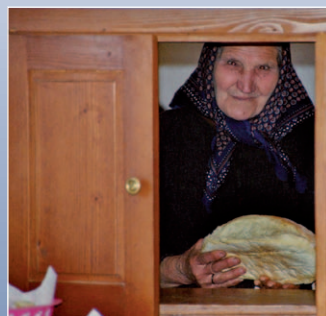
Die Menschen aus Belozem leiden an Hunger und Kälte.