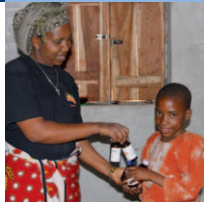
Theresia bekommt Medikamente