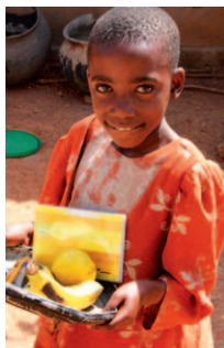
Vitaminreiche Früchte, Schreibmaterial, Seife, Zahnpasta ... Dank der Spendengelder können die AIDS-Waisen versorgt werden.

CED STIFTUNG CHRISTLICHER ENTWICKLUNGSDIENST